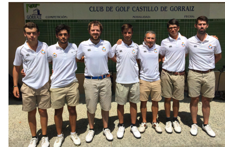
Equipo Absoluto Masculino