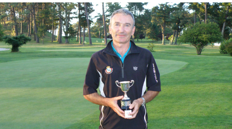
Campeón de Galicia Senior y Mayores de 30 años

Los días 13 y 14 de mayo el Golf Ría de Vigo fue el anfitrión del Campeonato de Galicia Mayores de 30 años Masculino en el que se proclamó campeón gallego el ju-