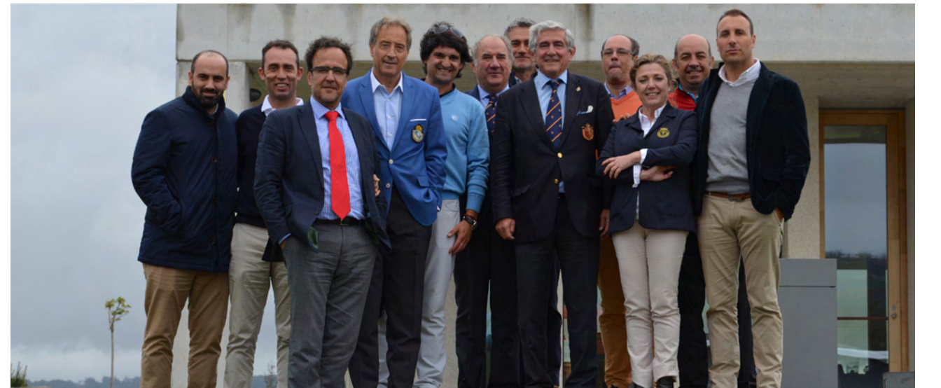
Reunion Gerentes Clubs en Santiago