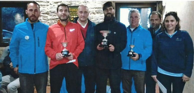
Equipo Campeón Cto Interclubes de Pitch&Putt