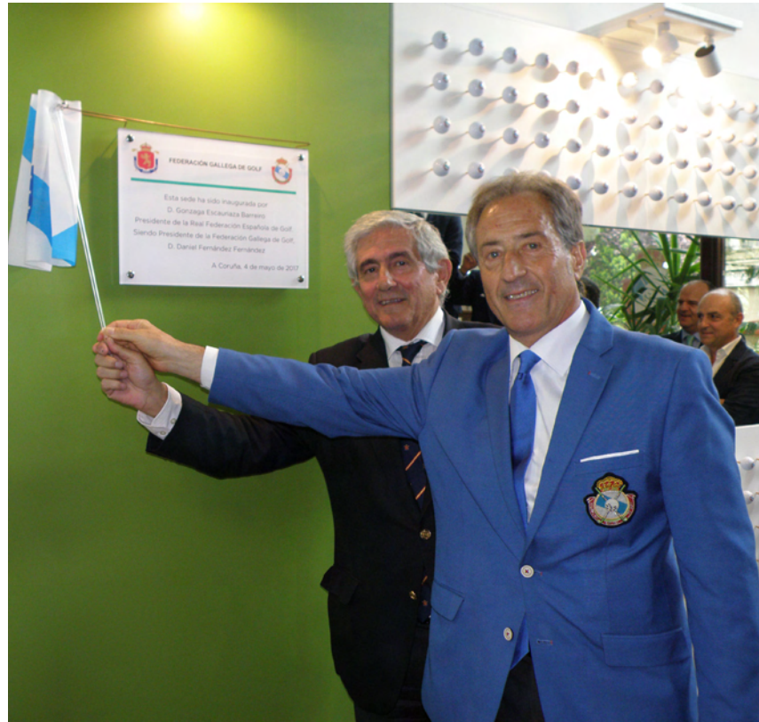
Inauguración Sede F.G.G.