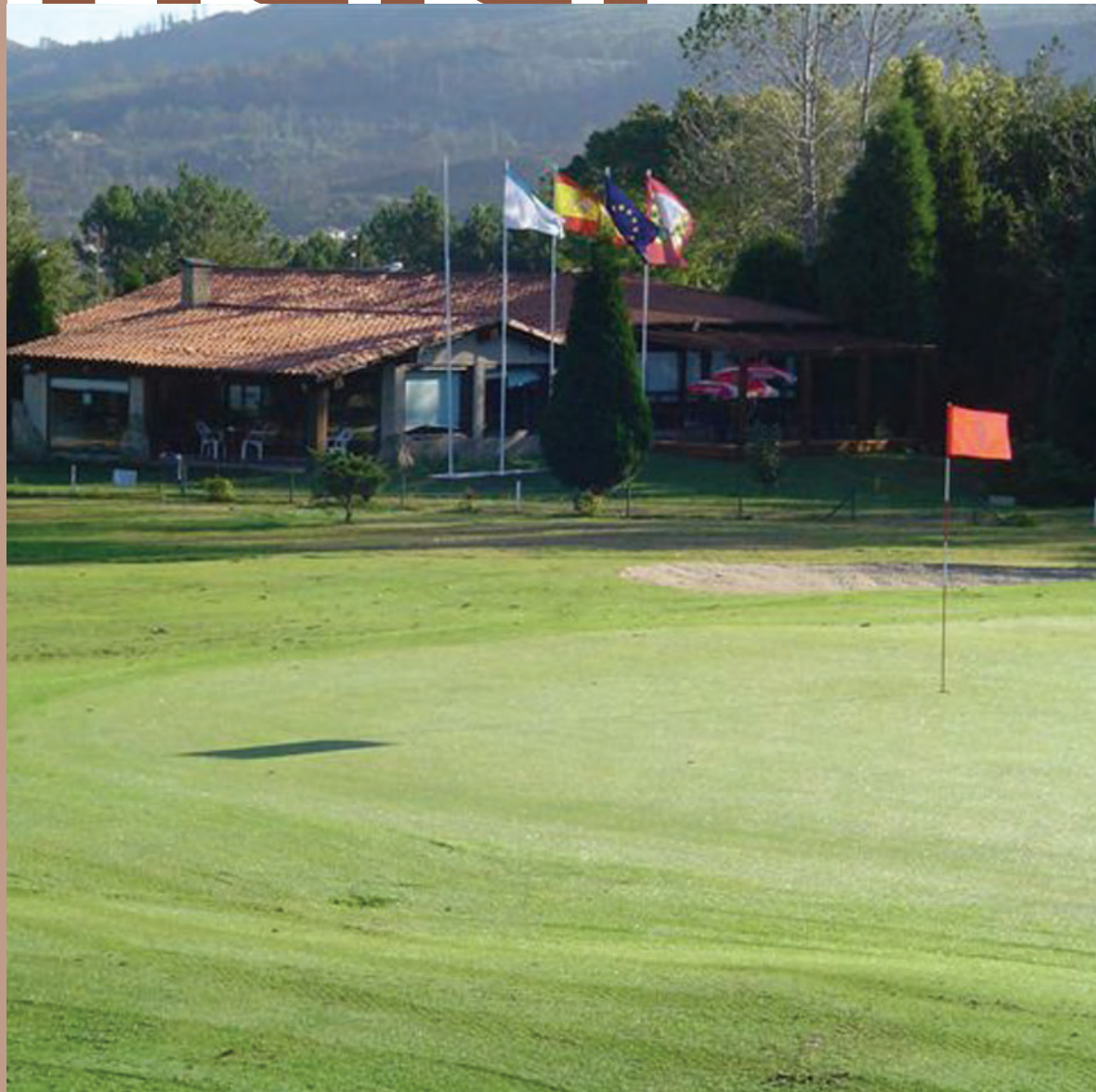
Club de Golf Val de Rois