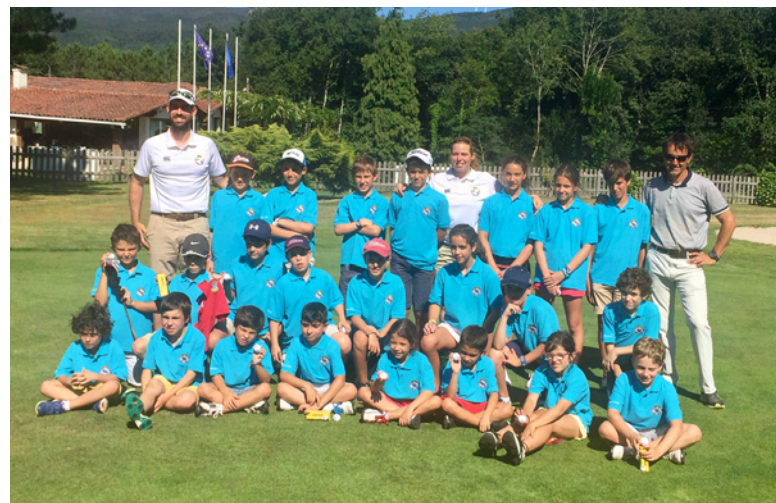
II Clinic Jóvenes Promesas

En este principio de temporada, varias jugadoras han recibido la llamada de los equipos nacionales. Tras su victoria en