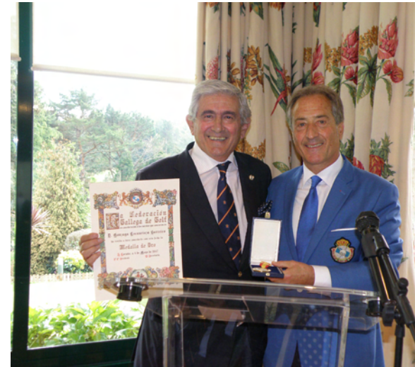
Entrega Medalla de Oro