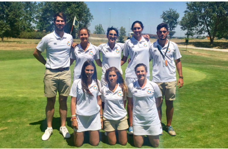
Equipo Absoluto Femenino