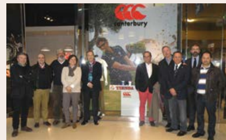
Junta Directiva en la tienda oficial de la F.G.G.