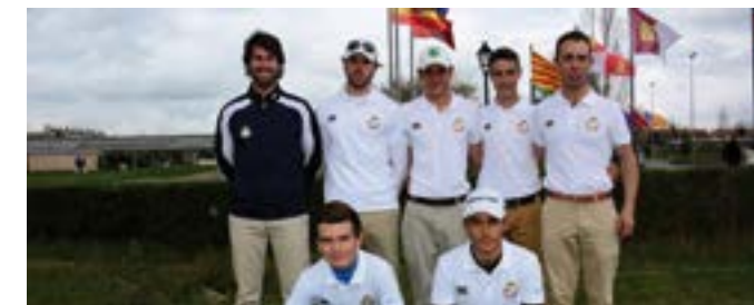
Equipo Gallego Interautonómico Sub18 masculino 2015