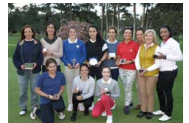
Premiadas Campeonato Galicia Femenino 2015