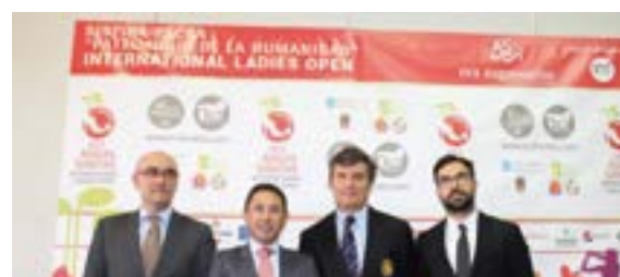
Presentación oficial en la sede de la R.F.E.G.

Las condiciones climatológicas fueron las propias de esta estación en Galicia, que sin embargo permitieron a las participantes desarrollar un buen juego.