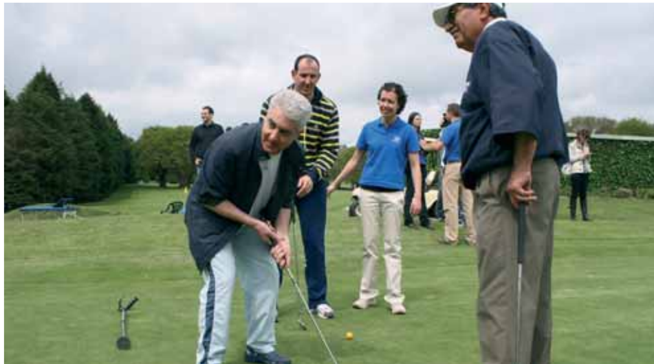
Los movimientos del swing obligan a trabajar áreas vinculadas al equilibrio, la coordinación, la resistencia o la fuerza