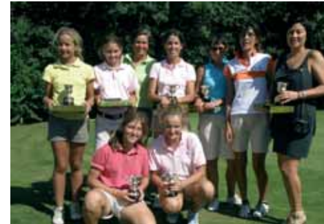
Grupo de Premiadas Cto Individual de Galicia Femenino