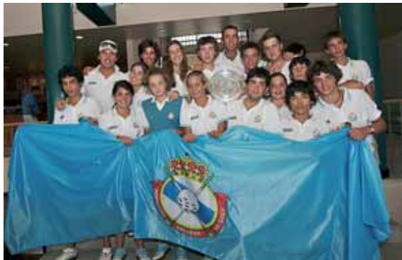
Equipo Juvenil Gallego-Match FGG-AGNP