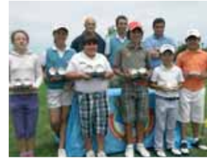
Grupo de Premios Cto.de Galicia Infantil y Cadete de Pitch&Putt

Y para finalizar con lo que se refiere a esta especialidad del golf comentar que el 18 de julio tuvo lugar en el Club Deportivo Tambre Golf el Campeonato Individual de Galicia de Pitch&Putt pero, debido a las presuntas irregularidades cometidas por el Club anfitrión durante la celebración del mismo, se ha trasladado toda la documentación al Comité de Disciplina Deportiva y será éste quien determine si el Campeonato ha sido válido o no. Mientras tanto, queda en suspenso la proclamación de los Campeones de Galicia de Pitch&Putt 2010.