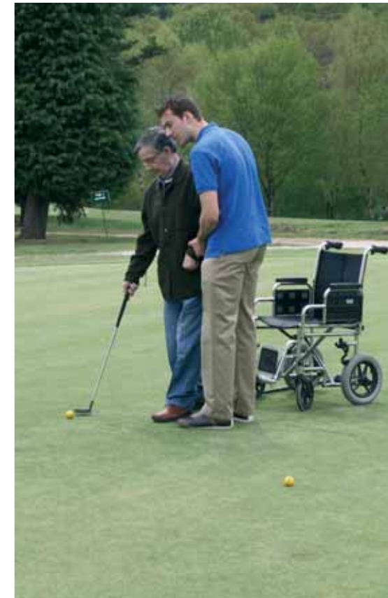
La iniciativa es pionera en Europa

Y si claros son los beneficios físicos, más importantes resultan todavía los psicológicos, puesto que el golf terapéutico aumenta la motivación y ayuda a alcanzar metas que en la clínica cuesta semanas alcanzar. El entorno natural y la propia dinámica del juego logran "pequeños milagros" muchas veces inimaginables en una sala de rehabilitación.