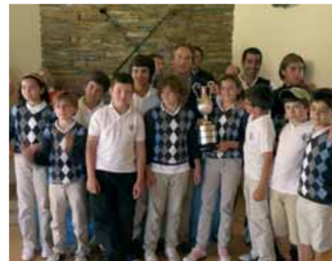
Real Aero Club de Vigo-Equipo ganador Liga Infantil Gallega 2010