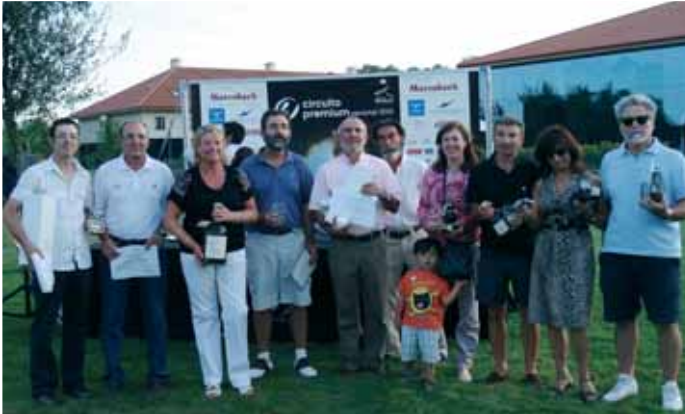
Ganadores Premium Augas Santas

El primer torneo organizado por la cadena OCA Hotels como nueva gestora del hotel Golf Balneario de Augas Santas, junto con la empresa Gambito Golf promotora del Circuito Premium, resultó un éxito tanto de participación (con 160 jugadores de toda España y Portugal), como de organización, gracias al clima y al buen estado del campo de golf, preparado a conciencia durante el último mes. Por ello, la empresa organizadora decidió repetir experiencia la próxima temporada en Augas Santas durante un fin de semana para dar cabida a más jugadores, y organizar nuevas pruebas, dadas las propicias condiciones que ofrece el resort de Pantón para acoger grandes circuitos de golf a nivel nacional y el potencial turístico de la Ribeira Sacra.