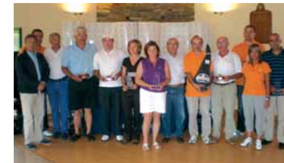
Participantes en el VI Torneo Ditrám

Además de la tradicional entrega de trofeos, Ditrám clausuró su torneo con un generoso sorteo lleno de artículos de última generación de TaylorMade y un gran cóctel, preparado por el mesón de Alberto que resultó del agrado de todos los presentes.