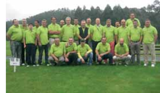
Foto de familia de la III Copa Palavea