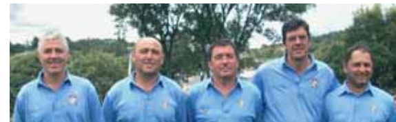
Equipo Gallego Cto.Nacional Interterritorial de Pitch&Putt 2010

El campo gallego del C.G. Pozo do Lago fue, a mediados de julio de este año, el anfitrión del IV Match Internacional España-Portugal de Pitch&Putt en el que el equipo nacional,