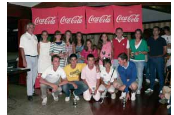
Foto de los ganadores de la Semana de Oro Joven 2010